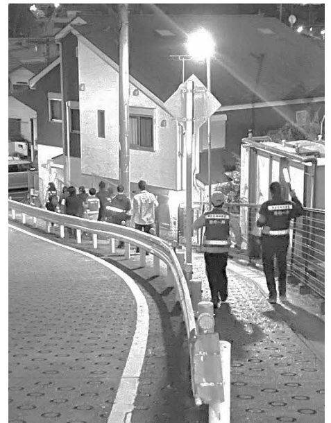
【千代田中学校区でのパトロールの様子】

情報交換では「暗くなっても公園で、たくさんの中高生が遊んでいて驚いた」「自分の地域に比べ、歩道が広がった」「自分の地区では、朝の見守りを中心に活動している」などの意見や感想がありました。