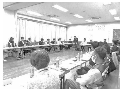
【四街道中学校区での情報交換の様子】