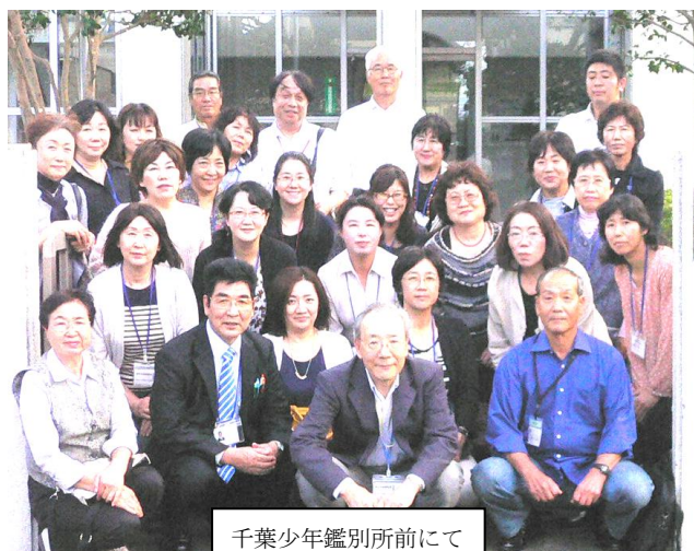
千葉少年鑑別所前にて

10月9日(水) 四街道市青少年補導委員と育成センター職員の32名が参加し、視察研修会が開催されました。