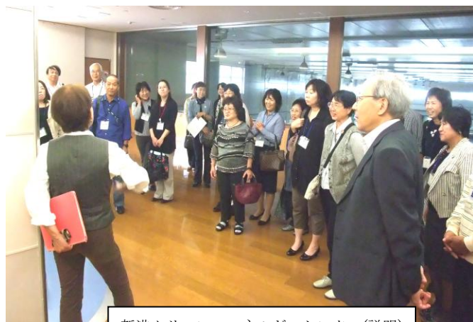
新港クリーン・エネルギーセンター(説明)