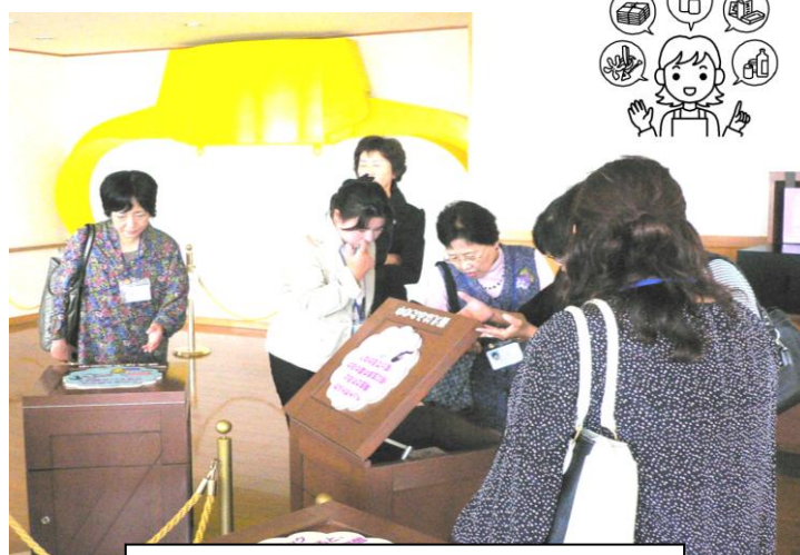
新港クリーン・エネルギーセンター見学の様子