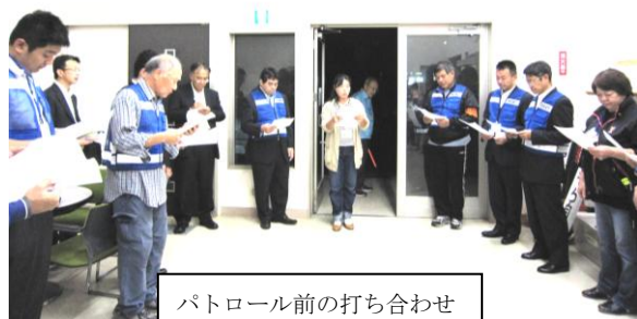
パトロール前の打ち合わせ

旭中学校区の小・中学校の校長先生・教頭先生とみそら自治会会長にも参加いただき、A(吉岡・鷹の台方面自転車通学路コース)、B(有害ビラ撤去コース)、C(サバイバルフィールド・コンビニコース)の3コースに分かれてパトロールを行いました。