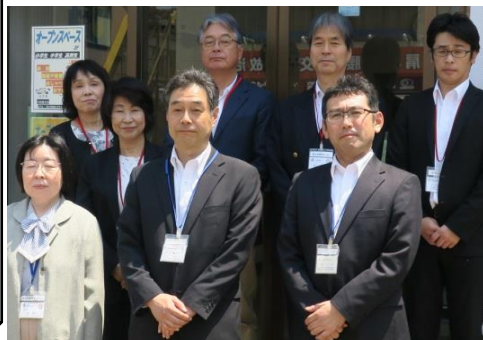
平成28年度 センター職員 of the 皆さん

青少年育成センターのオープンスペースをご利用ください。利用時間は午前9時から午後5時。お問い合わせは0433-78670。