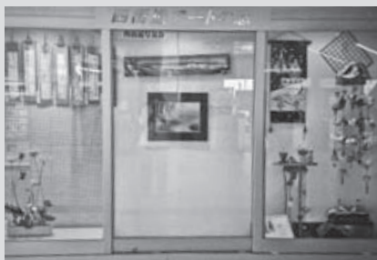
「四街道アートの窓」全景