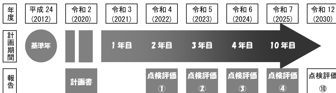
図表10-1-3 本計画の計画期間

本計画の基準年は平成24年度です。また、計画の期間は令和2年度(2020年度)から令和12年度(2030年度)までの11ヵ年間です。