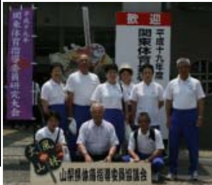
関東体育指導委員研究大会(H19年6月)