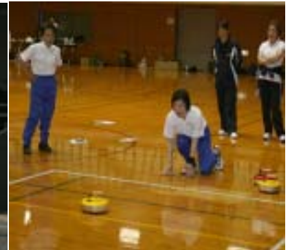
地域スポーツ活動推進事業にて フロアカーリング講習 (H19年5月)