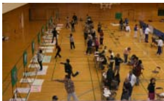
ニュースポーツ大会ダーツ

参加者は 20 名で男女別ダブルスに挑みました。試合はサーブ、スマッシュともに驚くほどスピード感があり、また、激しいラリーもあり、とても白熱していました。