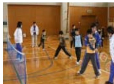
ショートテニス教室の様子 (和良比小学校にて)

家族で参加できて、良かった。 今後も参加したい。 もう少しゲームをしたかった。 初めてでしたが、楽しかった。