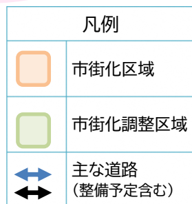
土地利用のイメージ図

この地域は、今後も市の発展を主導する重要な地域であることから、地域の魅力向上に向けた土地の有効活用を促進することにより、多様な機能との相乗効果を創出し、さらなる発展を目指します。