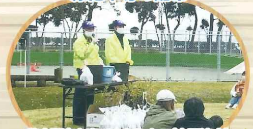
苗木配布と育て方セミナー（木更津市）