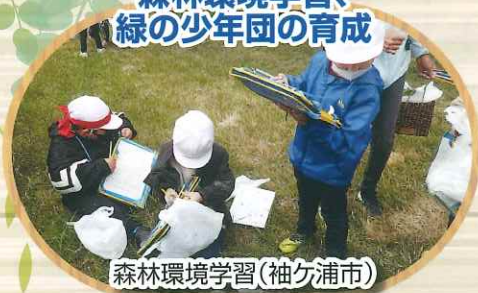
森林環境学習（袖ヶ浦市）