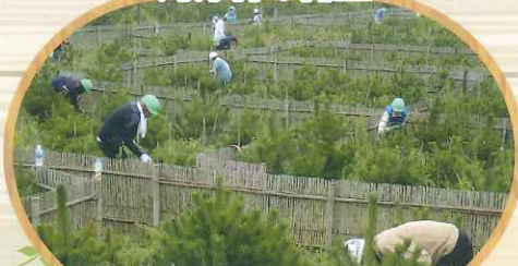
第2：緑の募金の森の造成（旭市）