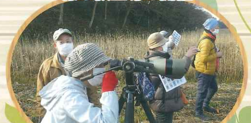
松戸の緑：再発見ツアー（松戸市）