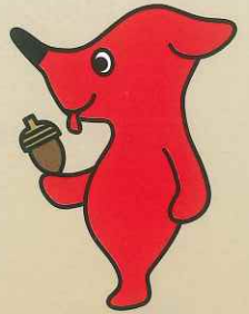
千葉県PRマスコット キャラクター「チーバくん」 千葉県許諾第A1072-7号

みどり豊かで安全な暮らし、そして、持続可能な地球環境を、県民の皆様と一緒に支えていただきたく、緑の募金に御協力をお願いいたします。