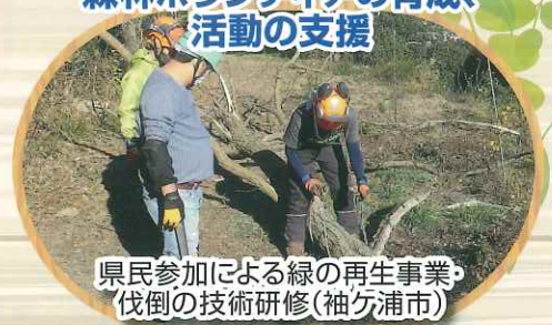
県民参加による緑の再生事業・ 伐倒の技術研修（袖ヶ浦市）