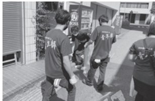
JR四街道駅前の清掃活動にて

青年部ヤングバザールは行う予定です。会員の皆さま！市民の皆さま！今年も皆様のご協力のもと、会場では十分なコロナ感染対策を行いお待ちしておりますので、是非ご来場下さいますようお願いいたします。