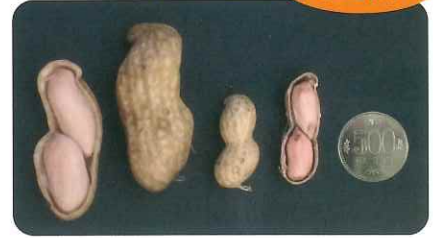
おおまさり 一般的な落花生