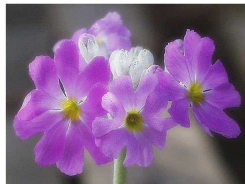
市の花「サクラソウ」